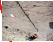
5 : ÉLEVÉ