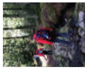
2 : ASSEZ FACILE