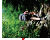
5 : DIFFICILE