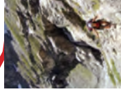
4 : ASSEZ ÉLEVÉ