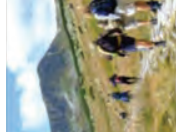
2 : ASSEZ FAIBLE