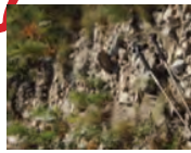
3 : PEU DIFFICILE