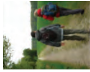
1 : FAIBLE

Pour l'obtenir, observez la configuration des terrains au fil de votre randonnée, estimez le niveau auquel vous êtes majoritairement confronté mais ne reprenez que le niveau le plus élevé rencontré.