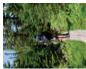
1 : FACILE

Pour l'obtenir, observez les obstacles au fil de votre randonnée, estimez le niveau auquel vous êtes majoritairement confronté mais ne reprenez que le niveau le plus élevé rencontré.